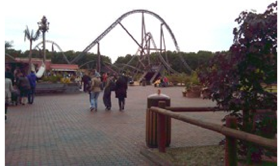
Børneudflugt til Djurs Sommerland 2011