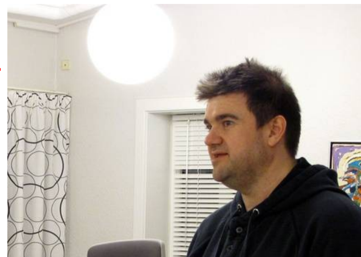
Stand-up Show i Oasen

Økonomien styres af projektansatte under Fællessekretariatet