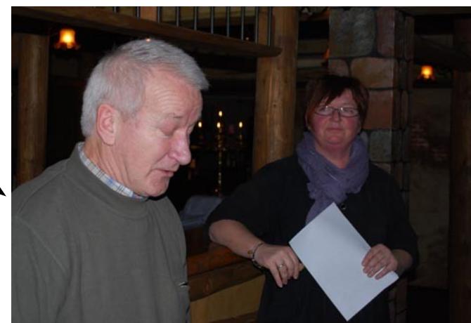
Nytårskur januar 2011